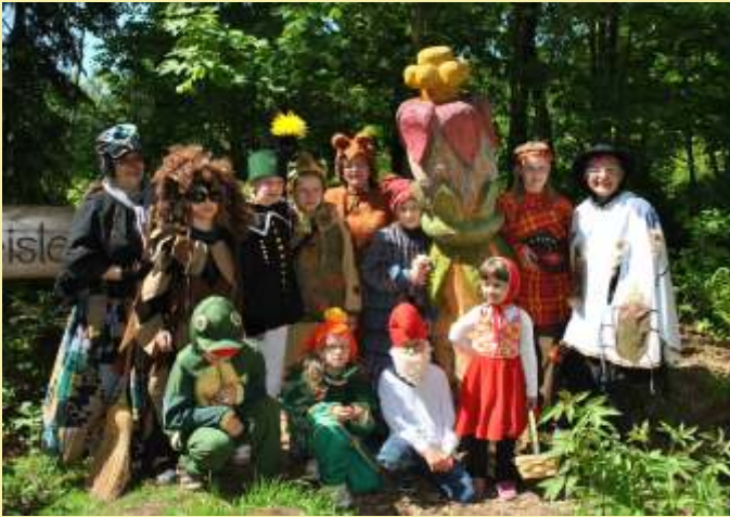
Waldgeister an der Wunderblume

Dieser Wanderweg hat zur Zeit eine Länge von ca. 2 km. Geplant ist eine Erweiterung nach Geyer und Thum.